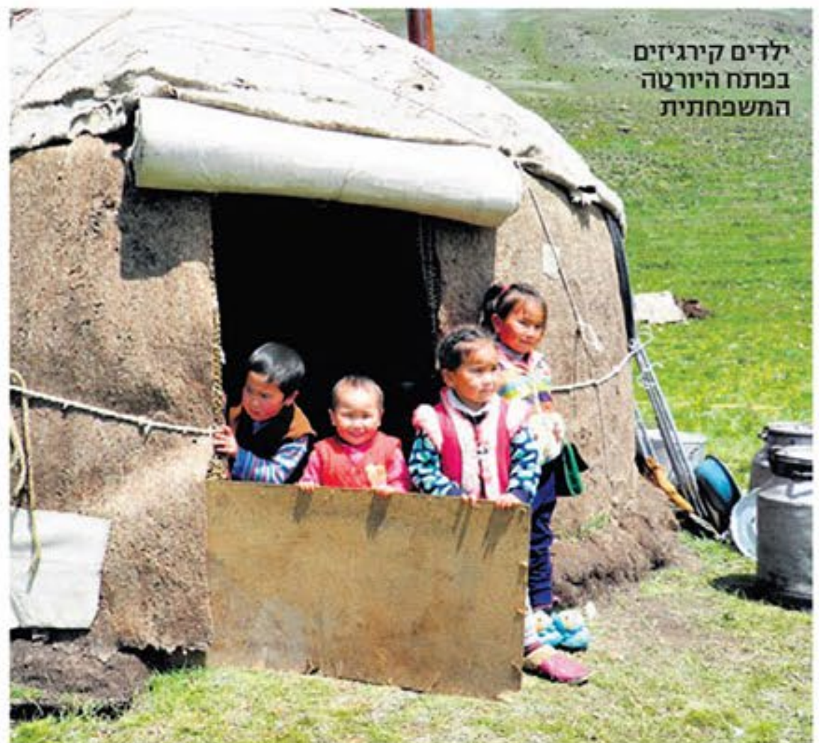
ילדים קירגיזים בפנתח היורטה המשפחתית