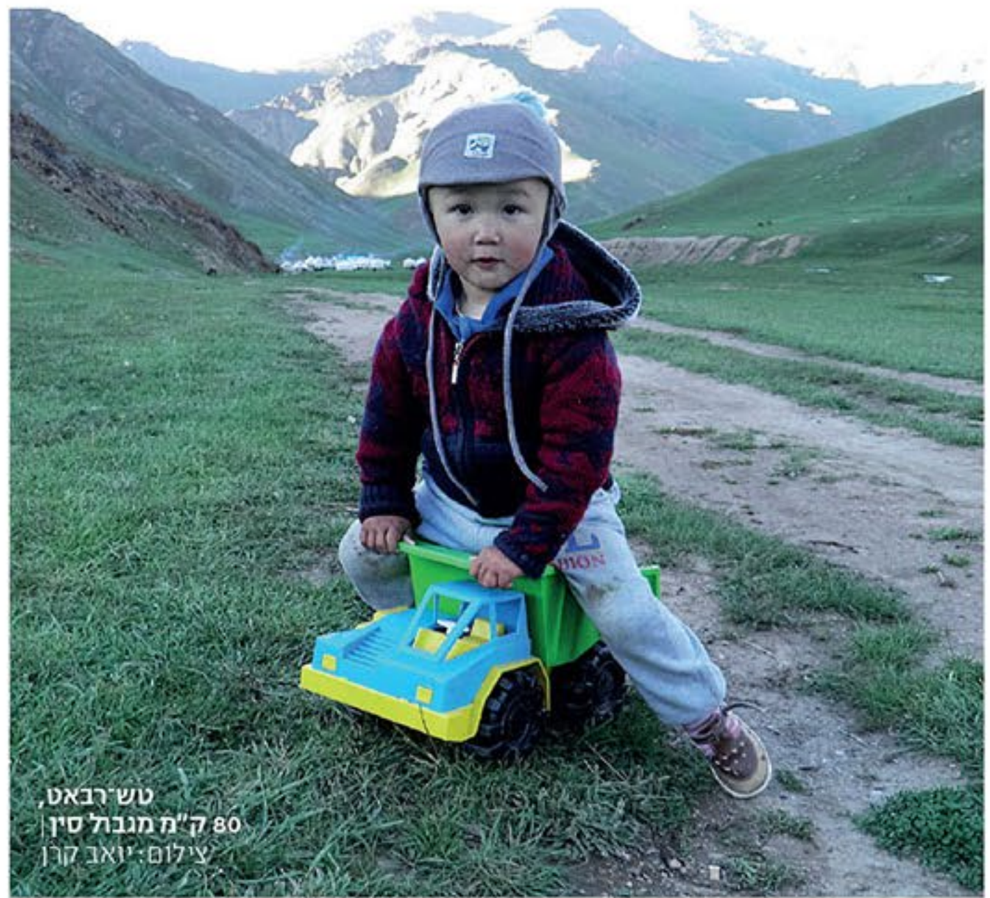
ט־רַבַּאט, 80 ק"מ מנבול סין

אורכו של אגם איסי־קול הוא 182 ק"מ ורוחבו 60 ק"מ. לא לחינם הוא נחשב לאחד היתדות הקירגוזיים (לצד היורטה, הסוס, הר טנגרי, הכובע המסורתי הקרוי קלאפק, המוזיקה הקירגוזית ומאנאס, אבי האומה). בתקופה הסובייטית היה האגם אחד מאתרי