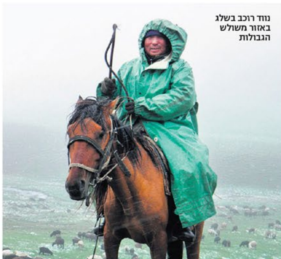
נווד רוכב בשלג באזור משולש הגבולות