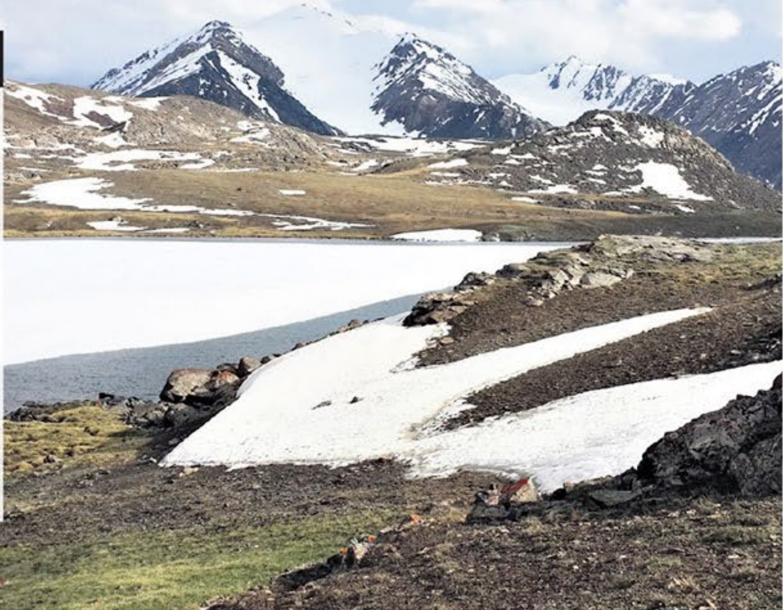
אגם קפוא ופסגות מושלגות בגובה 4,000 מטר

■ תושבי קירגיזסטן, שרובם מוסלמים, דוברים רוסית וקירגיזית. אנשי הצוות המקומיים יודעים אנגלית.