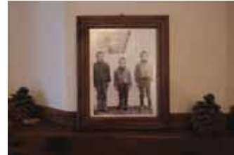
דחליל המיועד להרחיק פרות ממעבר בראש רכס הרים. למעלה: תצלום משפחתי בבית קפה כפרי

חבל הארץ של מרכז יוון מציע רכסי הרים, נהרות ואגמים, שמשקפים באור המסתגן מבעד לעננות של תחילת האביב. המדרונות המוצלים נצבעים בגוונים רכים, והקרירות שעדיין שוררת בחוף ממותנת על ידי החום של האנשים, האוכל, האווז והמוזיקה. התחלנו את הדרך באתונה ונסענו לעבר חבל אבריטניה (Evrytania), המכונה לעתים "שוויץ של יוון". השקפנו לעבר אגם קרמסטה (Kremasta), השולח זרועות ארוכות בין ההרים המיוערים. הנופים האלה שימשו תפאורה לרבים מסיפורי המיתולוגיה, וגם