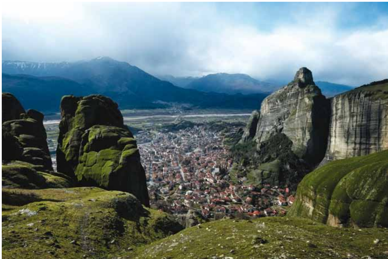
למעלה: העיר קלמבקה נשקפת בינות למצוקי מטאורה. למטה: איקונות מוזהבות באחד מבתי התפילה של המנזרים