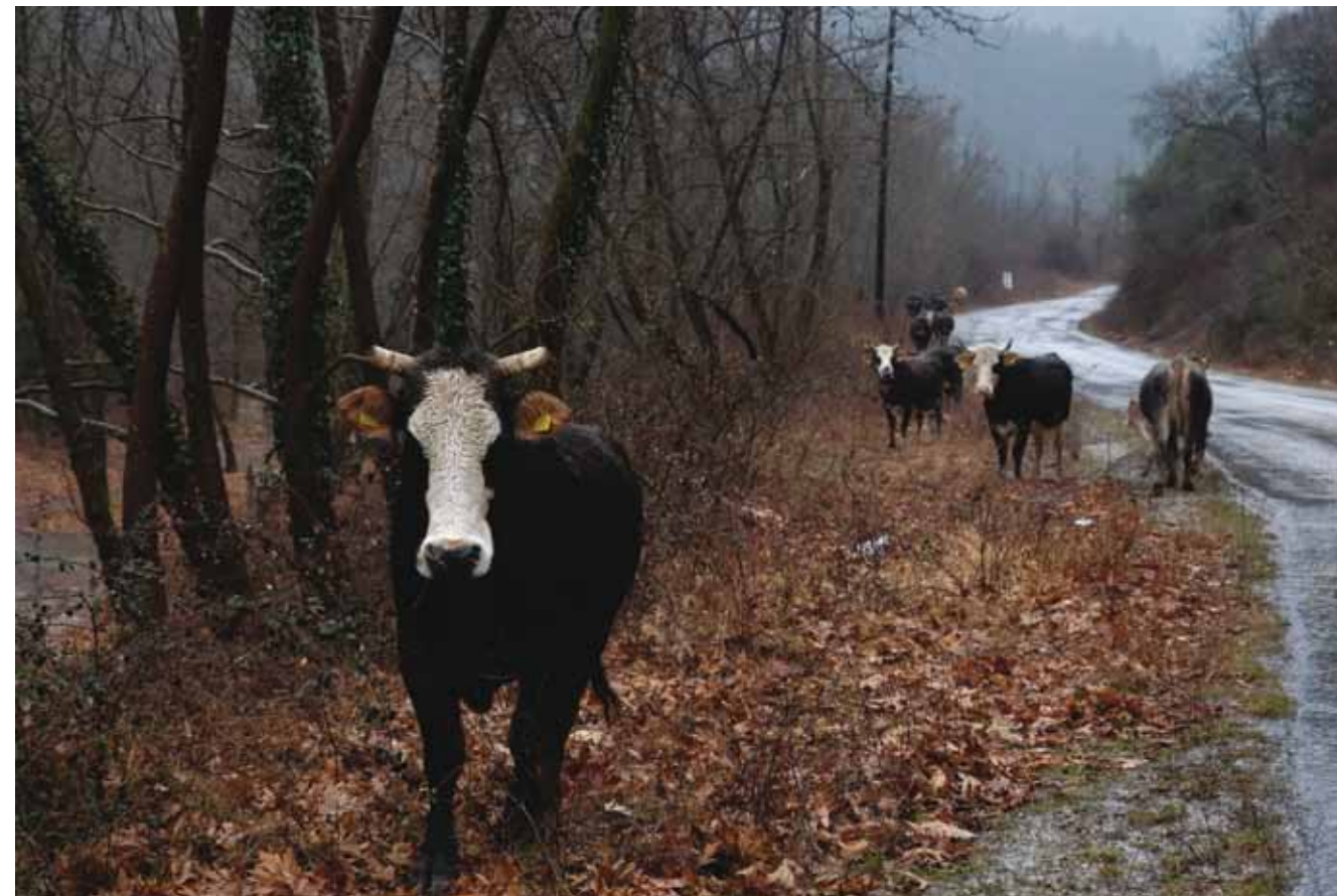
למעלה: פרות משוטטות בכבישים המפותלים של אבריטניה. למטה: ציידים נפגשים לעת ערב בבית קפה בכפר קרנדיס