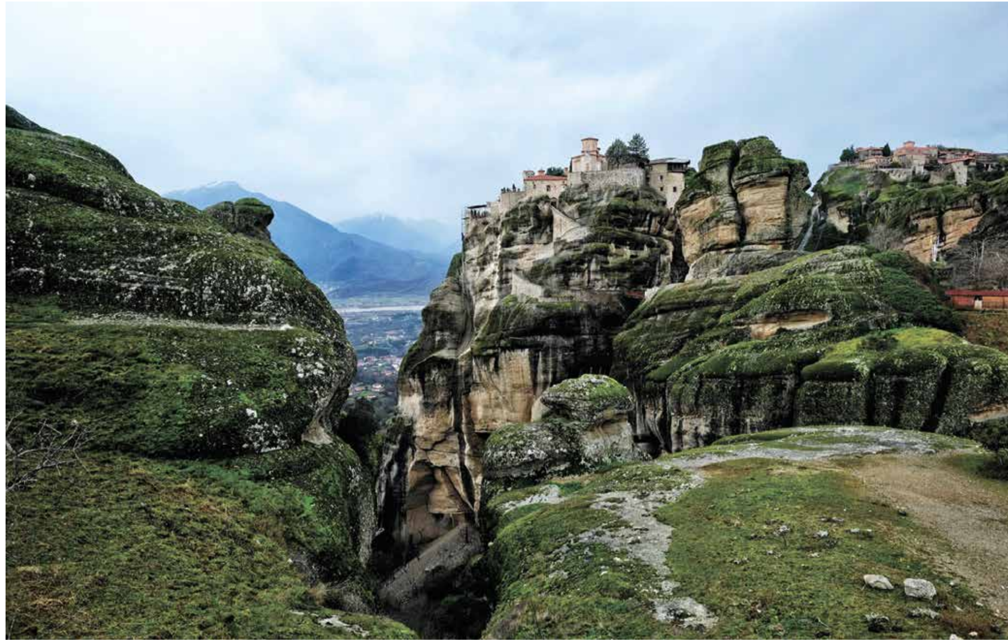
המנזרים התלויים במטאורה