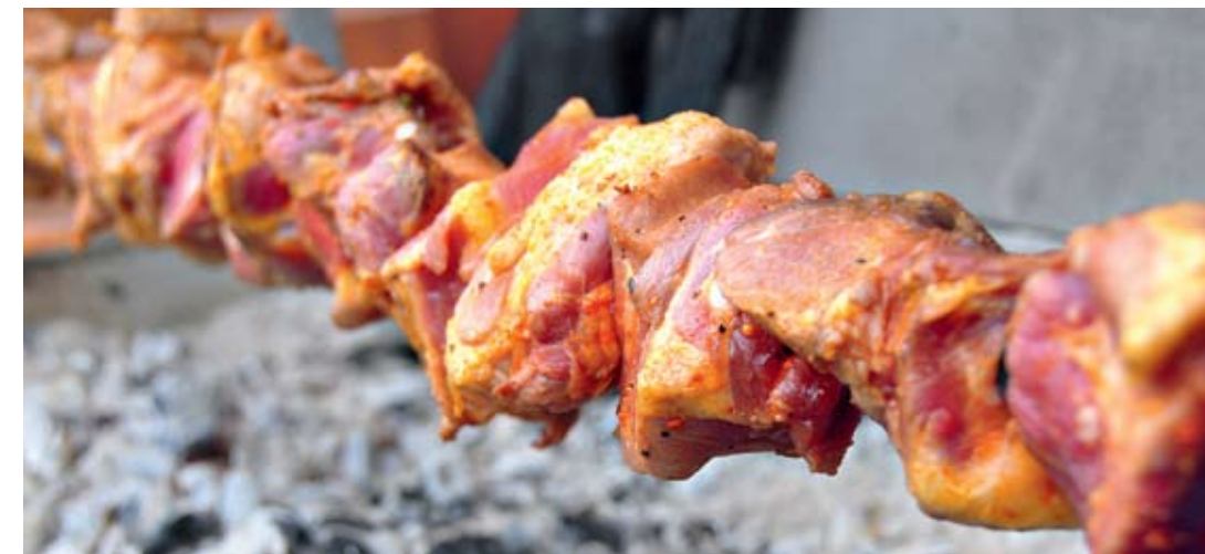
הנוף בשביל הנשמה, הבשר בשביל הגוף